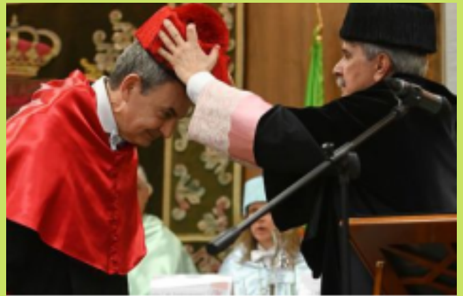
El expresidente del gobierno Rodríguez Zapatero, recientemente nombrado Doctor Honoris Causa.

Esperemos que no se quede solo en una promesa. ■