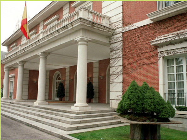
Palacio de la Moncloa

La nueva presidenta, militante del partido UDS (Unión Demócrata Socialista) es una madrileña de 44 años, cabeza de una familia monoparental con dos hijos a su cargo. Adela obtuvo su licenciatura en Ciencias Económicas en la universidad Carlos III de Madrid. Habla con mucha fluidez alemán, inglés y francés. Estuvo de embajadora en Berlín hasta el 2020. Seguramente esta XV legislatura será diferente. Adela es una mujer suficientemente preparada. Se declara una gran defensora de la igualdad de género en todos los ámbitos y está muy involucrada en la problemática de la violencia machista